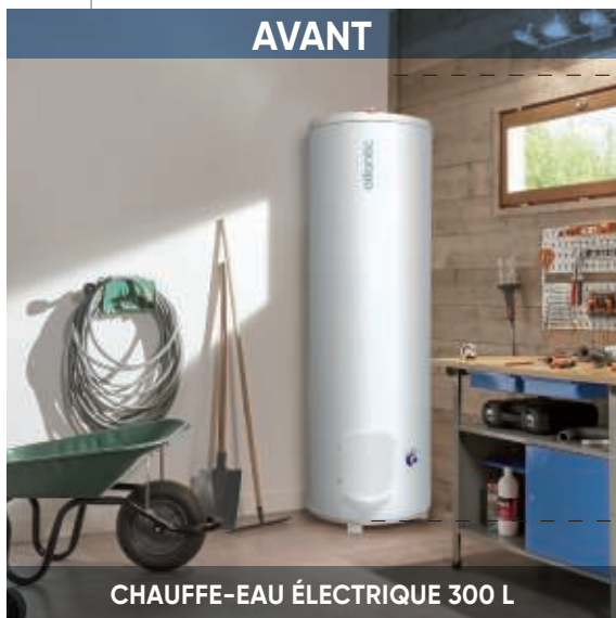
CHAUFFE-EAU ÉLECTRIQUE 300 L

Hauteur nécessaire à l'installation : 1,92 m